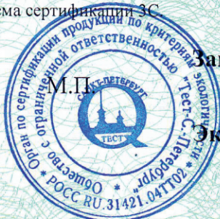
Схема сертификации ЗС

Разрешение на применение знака соответствия № РОСС RU.TT02.H00146 от 19.02.2021.